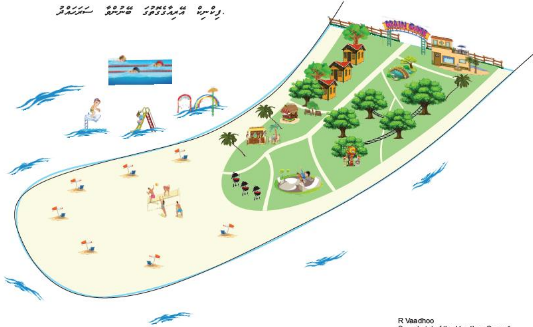
R Vaadhoo Secretariat of the Vaadhoo Council

වැඩසටහන, වැඩසටහන, වැඩසටහන, වැඩසටහන, වැඩසටහන